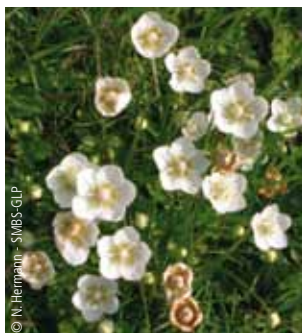
Parnassie des marais

Contrairement aux apparences, les dunes ne sont pas des milieux secs. Elles abritent des mares temporaires, appelées pannes, où se développe une biodiversité remarquable. Ces zones humides ont pris naissance au début du 19 e siècle. A l'origine, les pannes étaient de simples dépressions sur l'estran recouvertes par la mer lors des grandes marées. Progressivement, des cordons de sable ont isolé ces dernières des intrusions marines. Ces petits marais sont alimentés en eau par les pluies et les remontées de la nappe phréatique. C'est pourquoi les pannes sont généralement à sec en été.