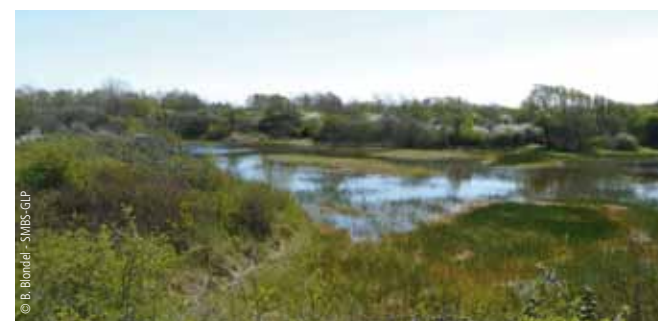
Vue panne humide

Parce qu'elles constituent de véritables oasis en milieu dunaire, les pannes sont des points d'observation privilégiés de la faune. Il n'est pas rare d'y voir un chevreuil en train de s'abreuver ou un Héron cendré à l'affût d'un Crapaud calamite, reconnaissable à la ligne jaune qui souligne sa colonne vertébrale.